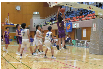
○バスケ 対 大田一中戦