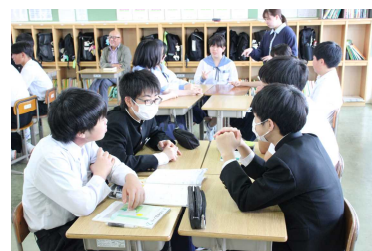
○2年「昨日の就寝時間は？」

※学校だよりは金城中ホームページにカラーで掲載しています。年間行事・月別行事もホームページでご覧いただけます。