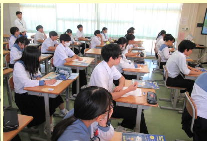
○しっかり集中して聞きました