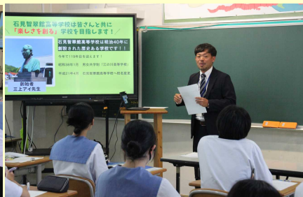
○高校の先生の説明の様子