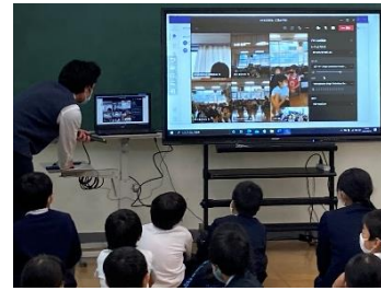
←教育委員会のICT支援員さん(左端)

しかし、本校では限られた条件の中で、それでも精一杯工夫して、 一つ一つの教育活動の質を上げる ことを心掛けました。そして、三階小学校に通う子ども達一人一人がそれぞれ「 自分らしく、一生懸命に勉強して、力をつける 」ことができることを、子ども達と学校職員の協働によって目指した1年間でした。