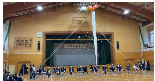
無事に割れた「くす玉」↓