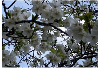
←↑品種は大島桜でしょうか。2本だけ7分咲きでした。