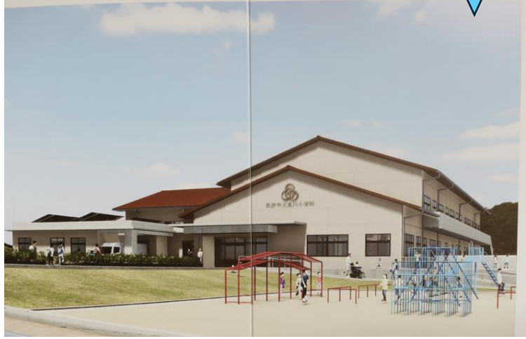
工事車両の入口フェンス付近に掲げられた新校舎イメージ