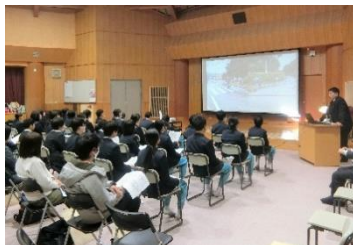
授業見学・校舎案内