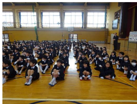
【担任発表の時の様子】

新しい年度、そして1学期を始める式、それが1学期の始業式です。何事においてもそうですが、物事の始まりはとても大切だと考えます。私自身、長浜小学校での勤務は2年目となりましたが、全校児童の前に立った瞬間、身が引き締められました。そんな私に、「力を抜いて…。大丈夫だから…。」そんな風に思わせてくれたのが、子どもたちでした。前に立つ私をキラキラした目でまっすぐに見つめ、姿勢を正し、真剣に話を聞いてくれました。頷きながら話を聞いてくれた子どももたくさんいました。その様子を見ながら、この子たちがいてくれれば大丈夫、この子たちと一緒にまた頑張るんだ、そう思えました。長い1年。どんな素敵なことが待っているのだろうかというワクワク感でいっぱいになりました。