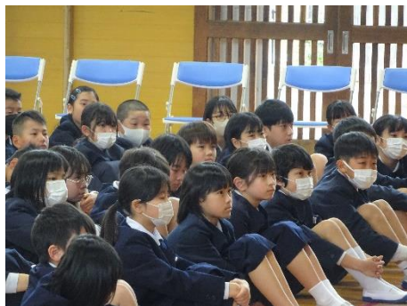
【話を聞く子どもたち】