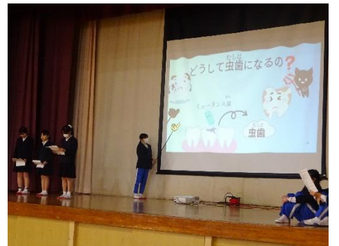
保健委員会【歯〜ぴかぴか集会】