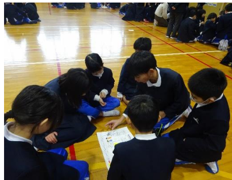
生活委員会【ふわふわ集会】