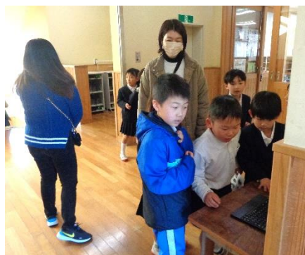
【PTA 活動：学校かくれんぼ】