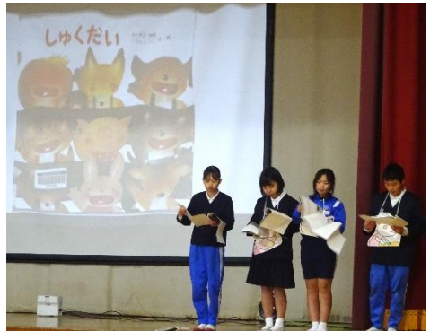
図書委員会【もくもく集会】

先月末から今月にかけて、委員会主催によるたくさんの集会有りました。どの集会も、「学校生活をもっとよくしたい」「楽しい学校にしたい」そんな願いを込めて、担当した委員会が企画・運営してくれたものでした。こういう集会をする際には、通常の委員会活動の時間はもちろん、休み時間等も利用して準備を進めます。必要な物の準備だけではなく、会をスムーズに進行するためのリハーサルも必要です。一つの集会所を創りあげるために、5・6年生はたくさんの時間と労力を費やしてくれているのです。