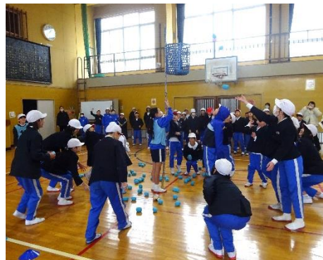
体育委員会【ミニ運動会】