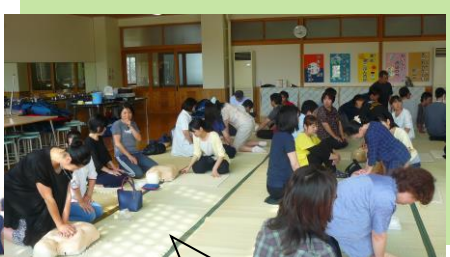
初めての小中合同 救急法講習会 H29. 6. 22