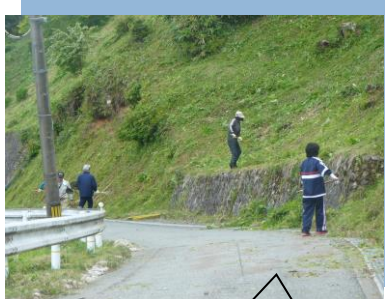
PTA奉仕作業 H29. 5. 27