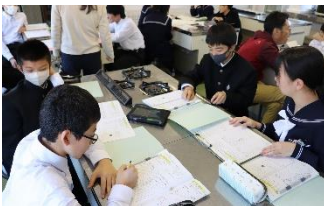
ドレッシングを考案中