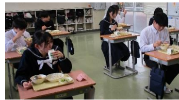
給食で試食し、投票へ