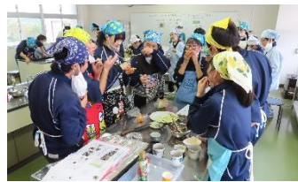
みんなで協力して試作中